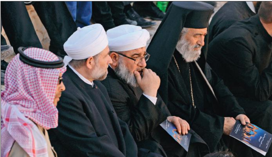
Представители различных конфессий объединились против ИГИЛ. На концерте симфонического оркестра петербургского Мариинского театра в Римском амфитеатре сирийской Пальмиры, освобожденной от террористов ИГИЛ.

В последнее время появилось значительное число верующих, причисляющих себя к крайним религиозным течениям (в СМИ упоминаются как «салафиты», «хариджиты», «ваххабиты»). Однако костяк ИГИЛ составляют лишь люди, причисляющие себя к ультрарадикальному крылу вышеназванных течений.