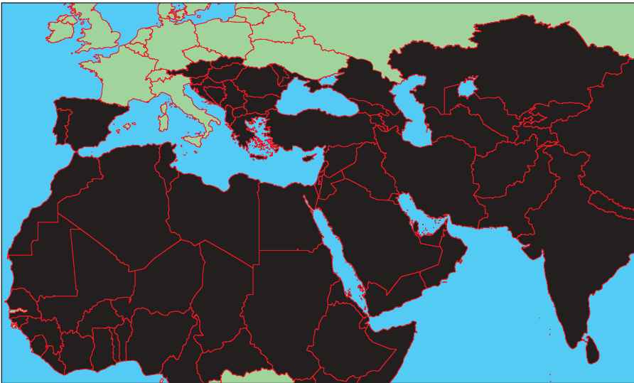
Карта мироустройства ИГИЛ

В настоящий момент группировка контролирует часть территории Сирии, а также ряд провинций в Ираке.