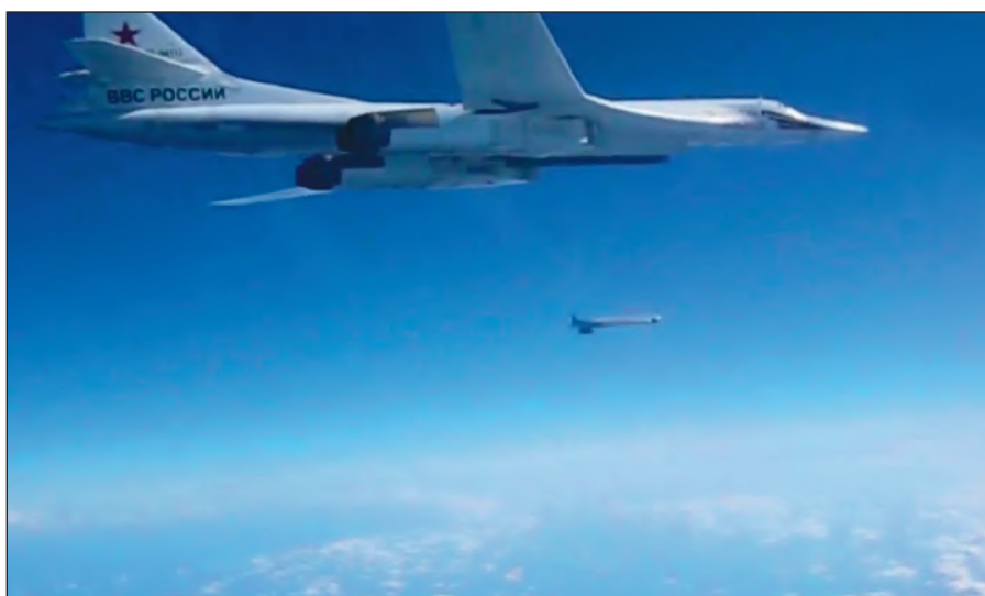
Воздушная операция российских ВКС по уничтожению боевиков ИГИЛ в Сирии.